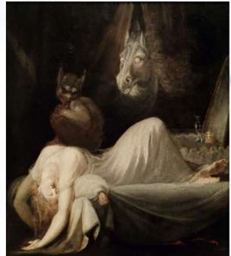
Le Cauchemar - Füssli

La scénographie visera à démultiplier le corps de Carine dans l'espace scénique selon la division gnostique des trois états de l'être : matière, âme et esprit. Cette division symbolisera le parcours intime de Carine tout au long de son rêve et sera élaborée par la scénographe en collaboration avec le peintre Fernand Bertemes.