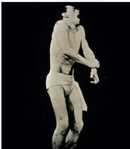
Le Prince Constant - Grotowski

La direction d'acteur veillera à l'élaboration d'une partition physique nourrie et mise en chair par l'imaginaire et les émotions des acteurs. Cette partition sera tour à tour le support de l'action scénique, le témoin de leur évolution au cours de la pièce, le point d'appui de libération des énergies instinctives de chacun des comédiens. Sur cette base, nous chercherons à proposer un jeu proche de la performance, c'est à dire un jeu où l'état de corps du comédien donne au personnage sa réalité émotionnelle et énergétique. Ce jeu non psychologique mais résolument corporel, nous le pousserons jusqu'à la performance pure via la création de séquences symboliques et plastiques au service du texte et de l'acteur. Enfin, la sonorité du texte sera explorée via un travail sur le chant improvisé et sur le souffle. Donner à cette langue magnifique et poétique, de la plasticité et du relief, donnera au jeu de l'organicité et débridera l'envol poétique, libérateur et créatif des acteurs.